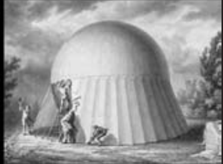
Dernière opération : le ballon est doté d'une jupe brise-vent.