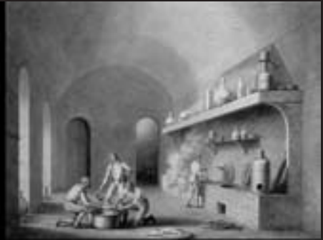
Essai d'une nouvelle fournée de vernis sur un fuseau.