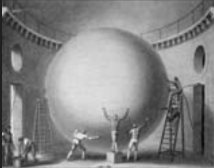
Le ballon gonflé est verni et imperméabilisé.