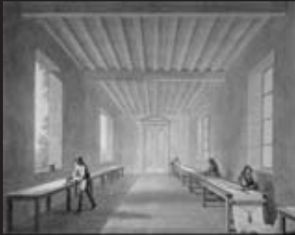
A Meudon, découpage des fuseaux dans du taffetas.